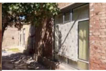
تصویر ۳: نمونه حیاط