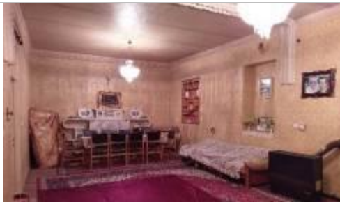
تصویر ۶: نمونه‌ای از اتاق پذیرایی در این الگو