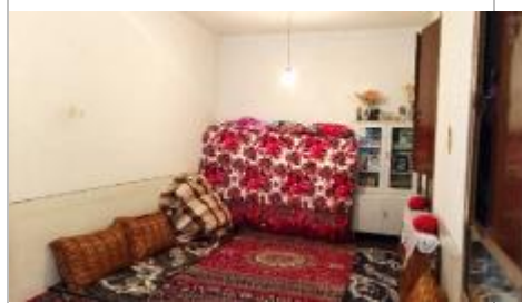
تصویر ۴: نمونه اتاق مهمان