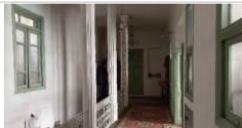
تصویر ۷: سالن (فضای پشت طنبی)