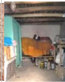
تصویر ۲: نمونه زیرزمین

در این خانه‌ها چند خانواده زندگی می‌کردند، یا به هنگام ازدواج فرزندان، یکی از اتاق‌ها به آنها اختصاص داده می-شده است.