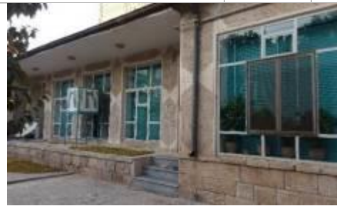
تصویر ۵: نمای جنوبی یکی از ساختمانها