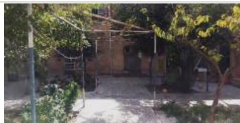
تصویر ۸: نمایی از حیاط و چپر (داربست درخت مو)