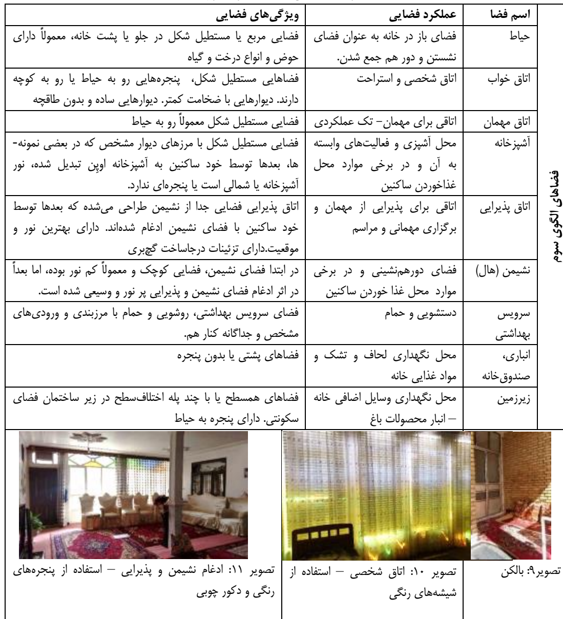
جدول ۵ - معرفی فضاهای الگوی سوم

این خانه‌ها در اواخر دوره پهلوی ساخته شده‌اند. همه‌ی فضاها در درون یک واحد ساختمانی یک یا دو طبقه قرار دارند. سرویس بهداشتی و حمام در داخل خانه ساخته می‌شود و فضاها به طور کامل مرزبندی و مستقل از هم