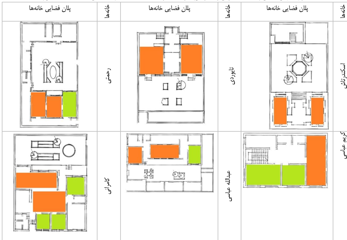
جدول ۱- پلان فضایی ( فضاهای عمومی و خصوصی) نمونه‌های مورد مطالعه خانه‌های ( بازه زمانی ۱۳۲۵ - ۱۳۵۰ ه.ش).